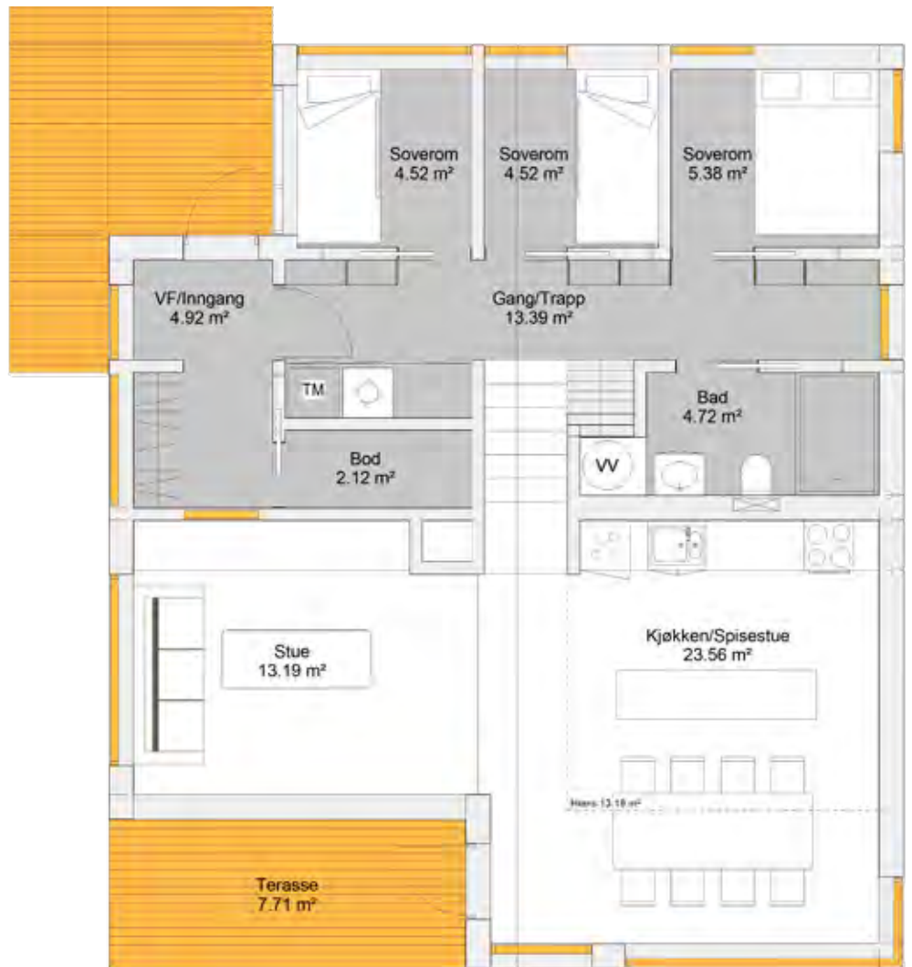
Hyttene kan leveres i størrelsene 50, 70 og 80 m 2 , og illustrasjonene viser hytta på 80 m 2 .